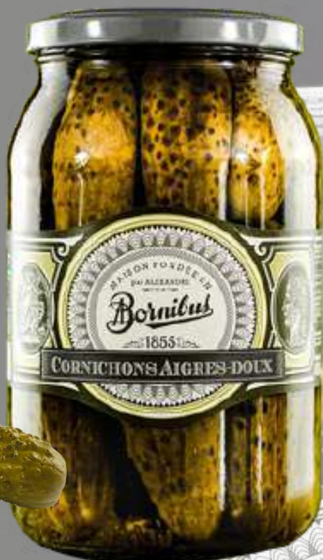
BS1800 PEPINILLOS AGRIDULCES 860G BORNIBUS