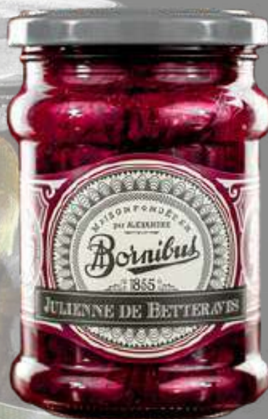
BS1815 REMOLACHA EN JULIANA 250G BORNIBUS